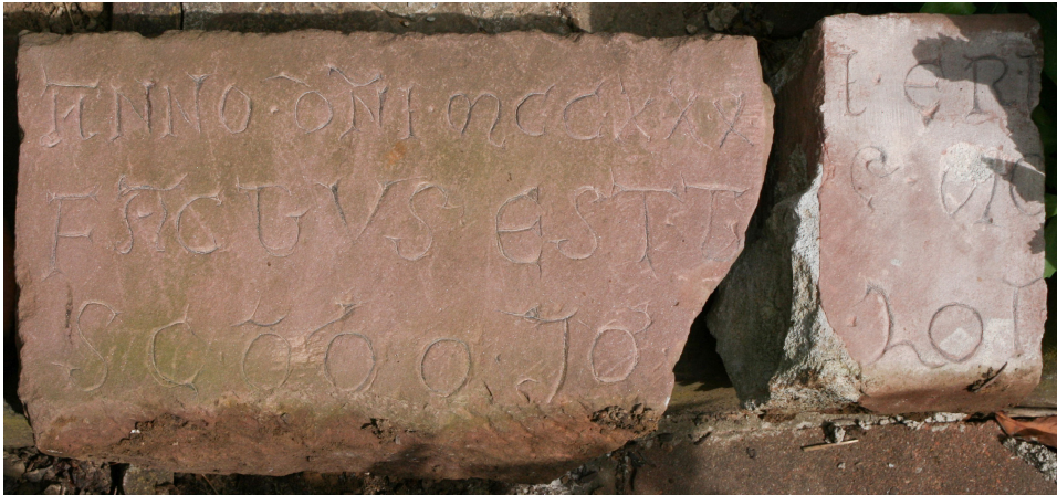
Abb. 1 Erdbebeninschrift aus Wombach, heute: Lohr am Main, Spessartmuseum