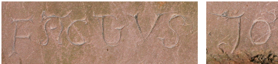
Abb. 4a, 4b