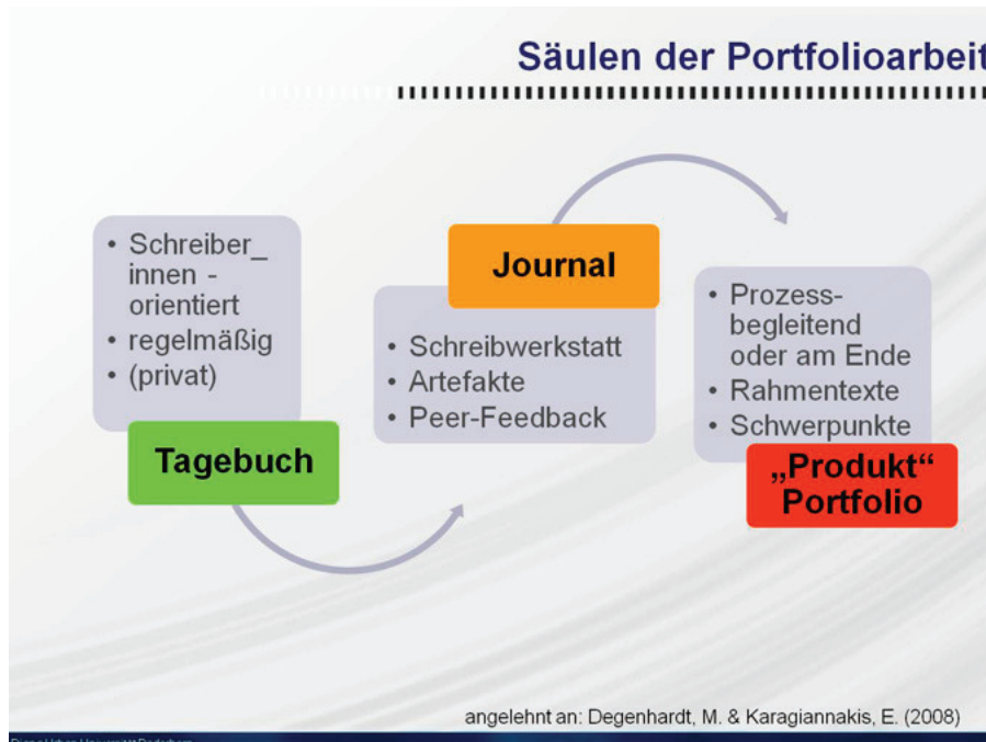
Abb. 2: Säulen der Portfolioarbeit

Arbeits- und angeleitete Reflexionsphasen gestatteten einen Einstieg bzw. die Weiterarbeit an dem eigenen Lernportfolio. Die erste Arbeitsphase im Rahmen der Session fokussierte dabei den Lern- und Entwicklungsprozess der Teilnehmer_innen. Angelehnt an den Fragebogen LIST (Lernstrategien im Studium) (Wild et al. 1992) wurden einige Fragen zur Einschätzung des eigenen Lernverhaltens in und außerhalb hochschuldidaktischer Weiterbildung formuliert. Eine zweite Phase diente einer gemeinsamen Ausein-